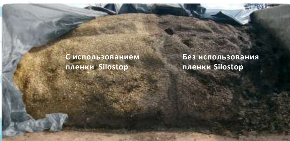
С использованием пленки Silostop